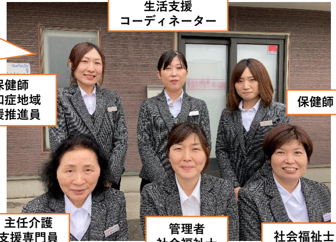
保健師 生活支援 コーディネーター